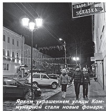
Ярким украшением улицы Коммунарной стали новые фонари.

Результатом разгула стихии явилось повреждение подвесного пешеходного моста в Ёгле. На сегодняшний день все необходимые материалы приобретены и начаты работы по восстановлению. На время ремонта моста для перевозки детей выделен дополнительный автобус.