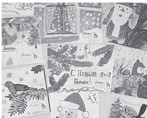
ОАО КБ «Пойдём!» Лицензия Банка России №2534 от 31.12.2010.

На снимках: клиенты собрались на новогоднее чаепитие; конкурс детских рисунков.