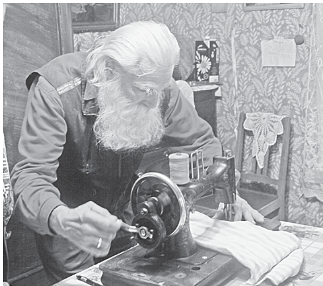
На снимках: главный герой новогодней были.

Телефон информационно-справочной службы приемной Президента Российской Федерации в Новгородской области: (816 2) 731-735.